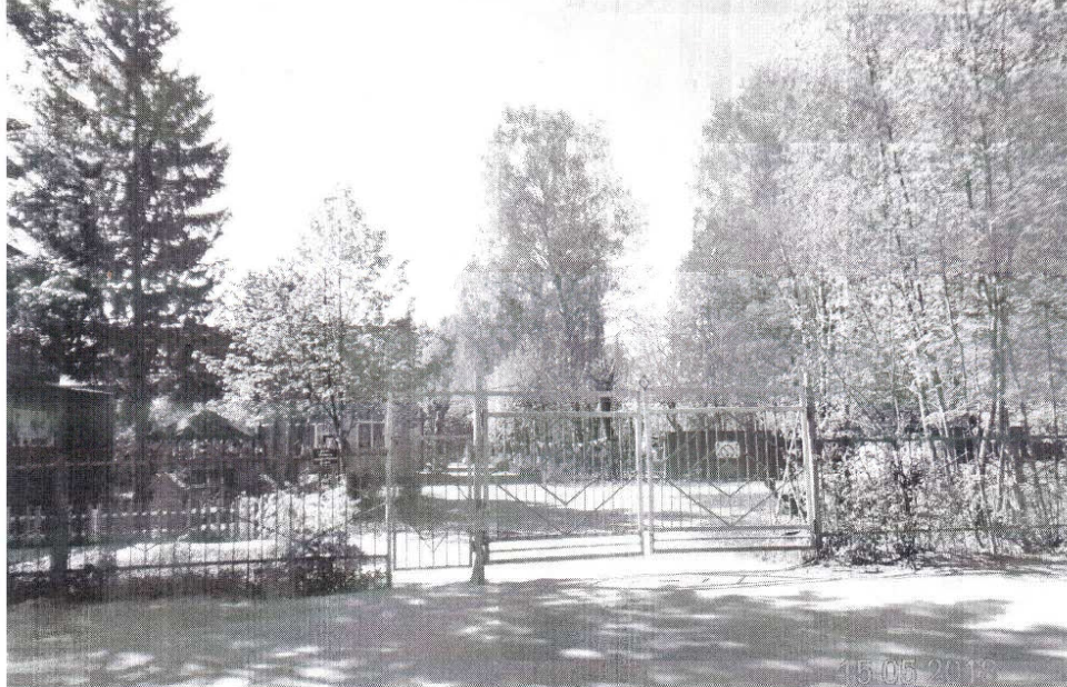
Снимок № 2