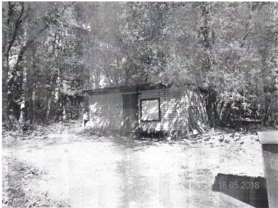
СНИМОК № 4